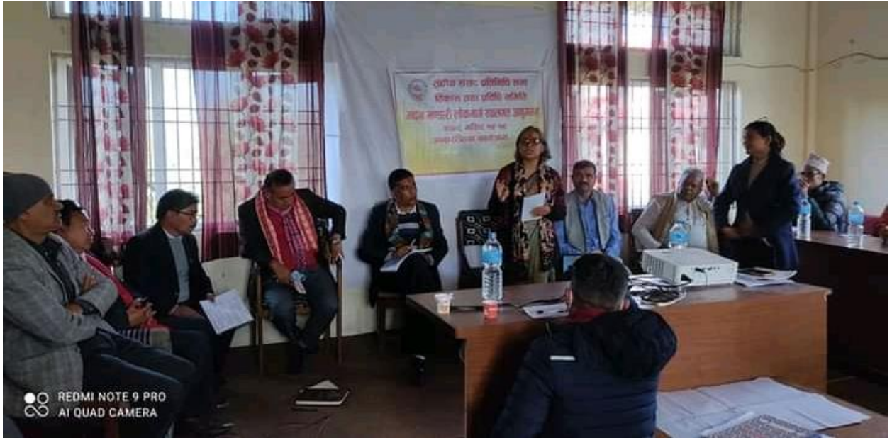
सिन्धुलीको दुधौलीमा भएको अन्तरक्रिया कार्यक्रम