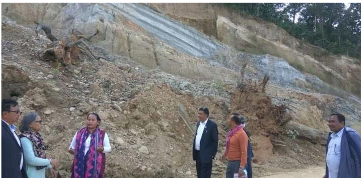
हरिहरपुर र मरिन गाउँपालिका बीचको खण्डमा रहेको पहिरो