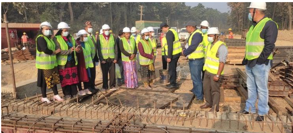
नवलपरासी (बर्दघाट सुस्ता पश्चिम) तर्फको निर्माणाधीन पुलको अवलोकन गर्दै