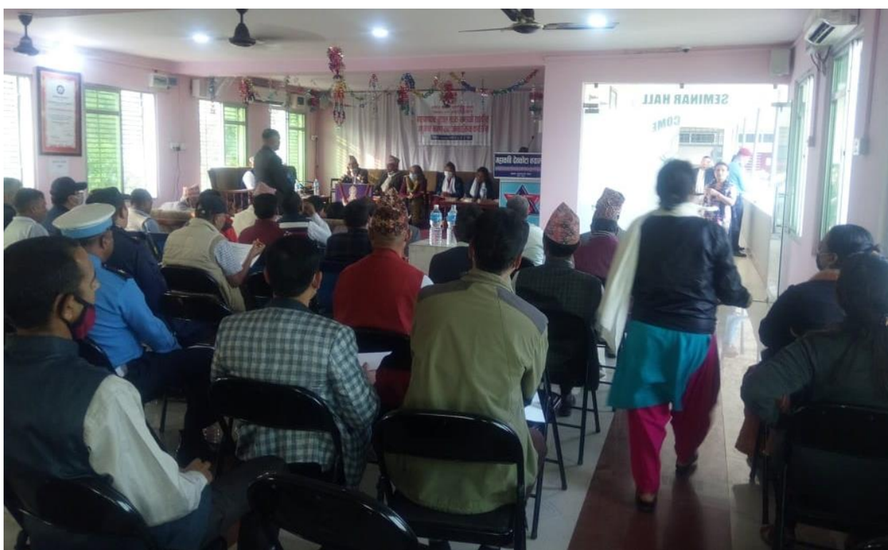
नवलपरासी (बर्दघाट सुस्ता पश्चिम) सुनवलमा भएको अन्तर्क्रिया कार्यक्रम