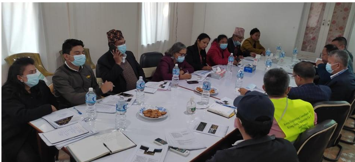
नवलपरासी (बर्दघाट सुस्ता पूर्व) गैडाकोटमा भएको ब्रिफिङ