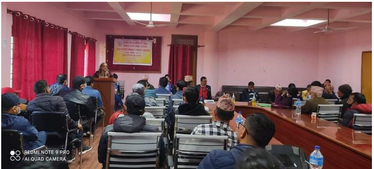
सिन्धुलीबजारमा भएको अन्तर्क्रिया कार्यक्रम