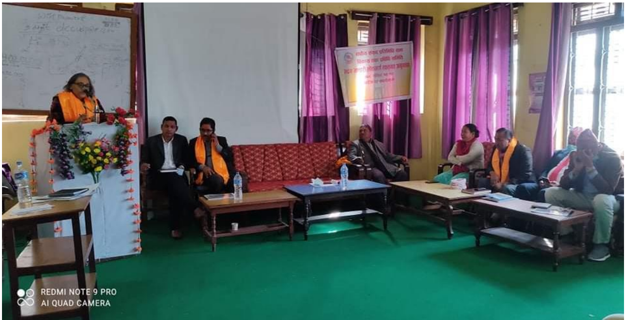
उदयपुरको गाइघाटमा भएको अन्तरक्रिया कार्यक्रम