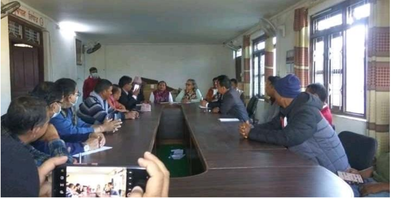
हरिहरपुर गाउँपालिकामा भएको अन्तरक्रिया

स्थलगत अनुगमन भ्रमण र अन्तर्क्रिया कार्यक्रमका केहि तस्बिरहरु