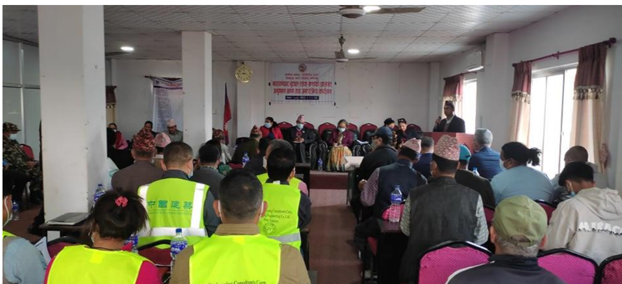
नवलपरासी (बर्दघाट सुस्ता पूर्व) कावासोतीमा भएको अन्तर्क्रिया कार्यक्रम